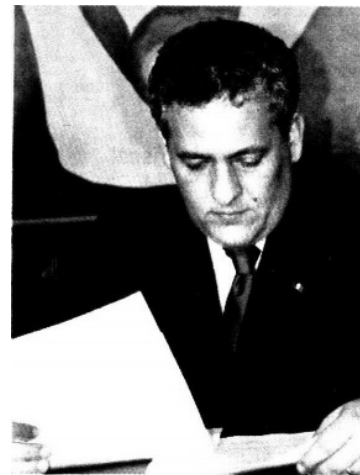
Arriba: El gobernador Juan Sabines