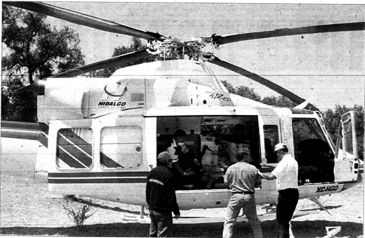
Todas las víctimas son hombres y vecinos de comunidades de Atotonilco de Tula y municipios colindantes. Acudieron a realizar maniobras de limpieza del pozo.