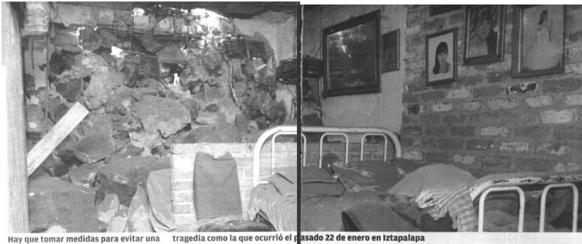
Hay que tomar medidas para evitar una tragedia como la que ocurrió el pasado 22 de enero en Iztapalapa

Funcionarios van y vienen, promesas aquí y allá, pero al final nada aportan en concreto y todo queda en buenas intenciones