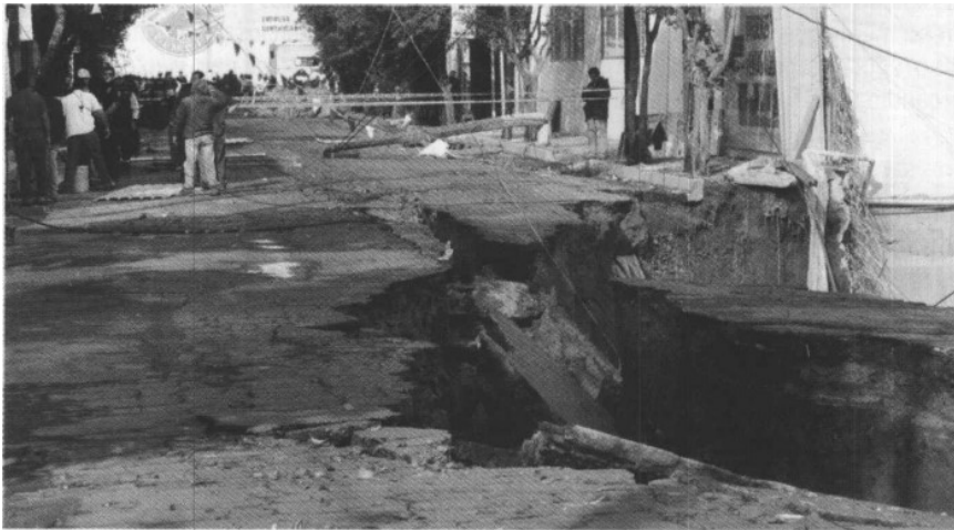
Las grietas avisan... ¿y las tragedias?

Funcionarios van y vienen, promesas aquí y allá, pero al final nada aportan en concreto y todo queda en buenas intenciones