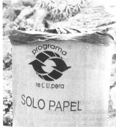
BOTE Sirve para recolectar el papel que será reciclado