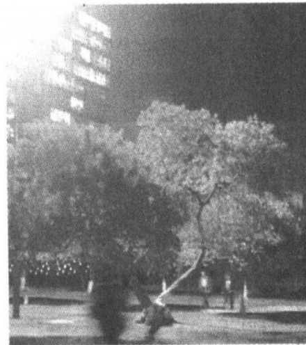
OBJETIVOS Uno de los principales es el ahorro de energía eléctrica