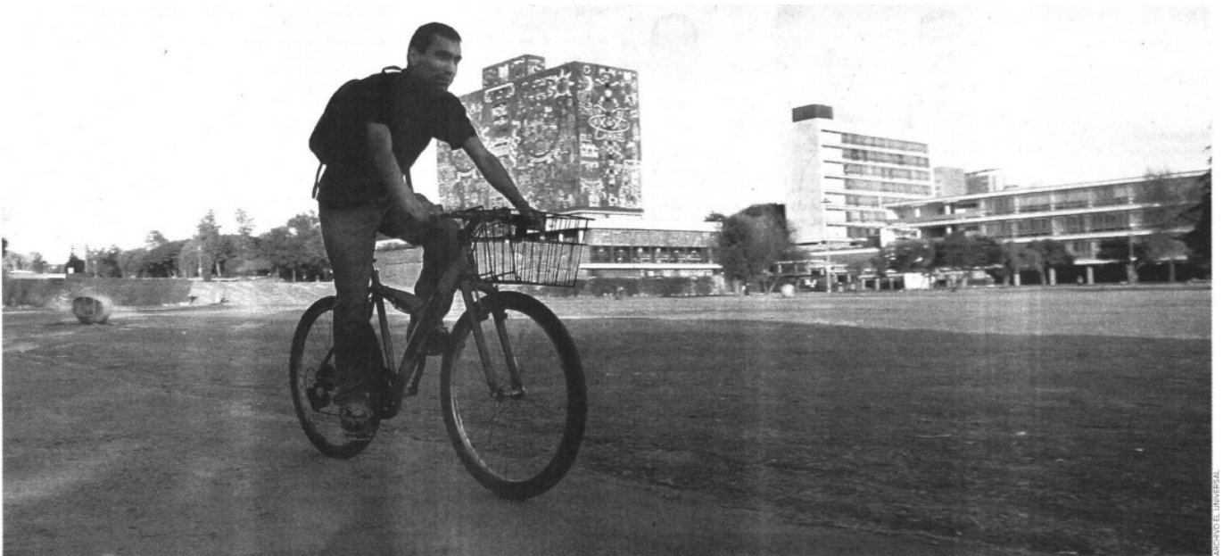
BICIPUMA Este servicio de transporte alternativo ecológico se ofrece en CU