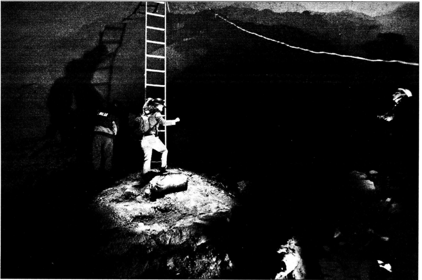
Recorrido por la mina de más de un kilómetro de largo que mediante estudios de geofísica se detectó bajo la colonia Molino de Rosas, en la delegación Álvaro Obregón