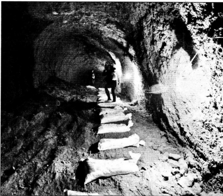
Aspecto de otro cuerpo de la mina, la cual fue recorrida ayer por reporteros y autoridades de la delegación Álvaro Obregón