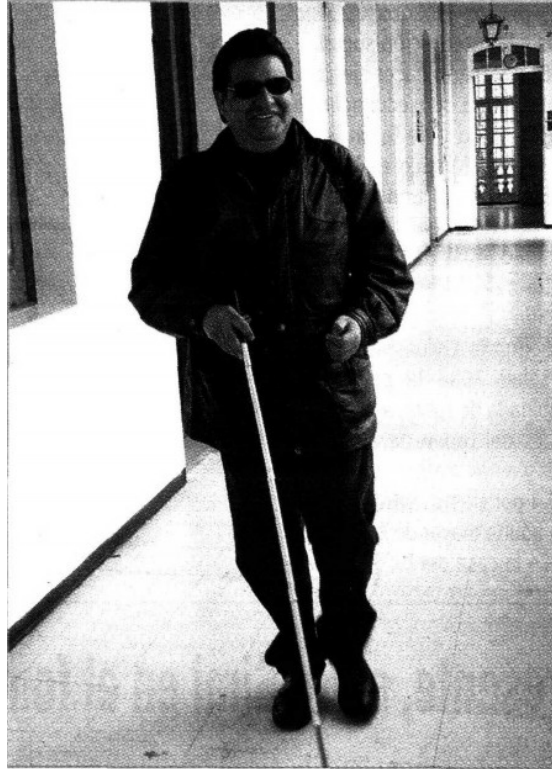
En el Comité Internacional Pro-Ciegos se brindan diferentes actividades recreativas y culturales, como teatro y música