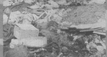
6. En Ixtepec, vísceras de animales y desechos de los mercados públicos están al aire libre.