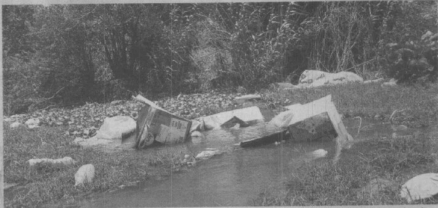
1. Cerca de 150 toneladas de basura que generan diariamente los 9 municipios por donde cruza el río Los Perros van a parar a su ribera o cauce.