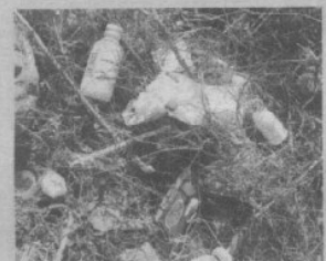
4. Jeringas y medicamentos son vertidos en la ribera del río.