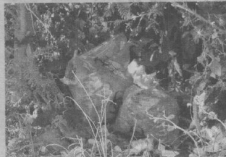
3. Al no contar con basureros apropiados, los desechos van a parar en tiraderos clandestinos.