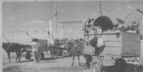
5. En Juchitán, el trabajo de los recolectores es insuficiente ante la cantidad de desperdicios.