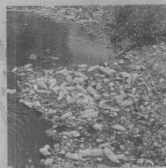
2. La basura forma tapones que puede ocasionar su desbordamiento.