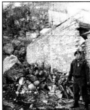
La acumulación de agua provocó el accidente