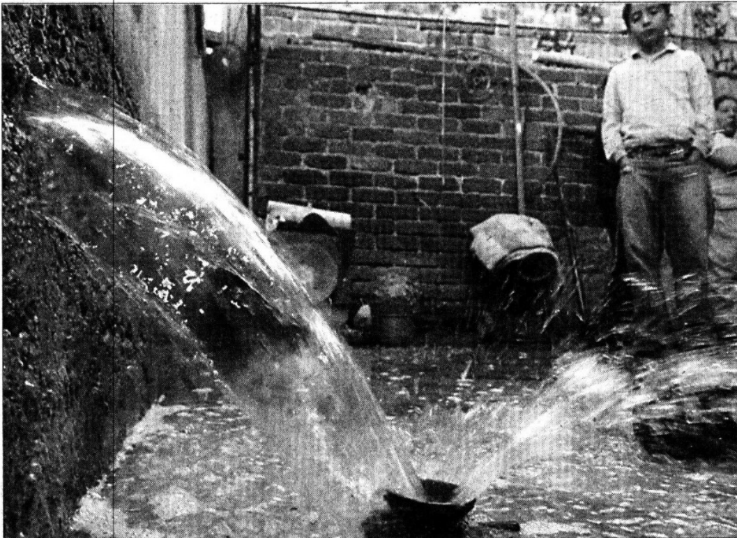
» EN LA colonia Ciudad Lago nada pudieron hacer para impedir las filtraciones de aguas negras.