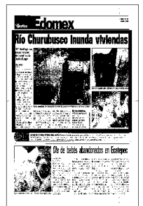
Por las reparaciones del drenaje profundo cerraron las compuertas y el agua corrió por Periférico Oriente