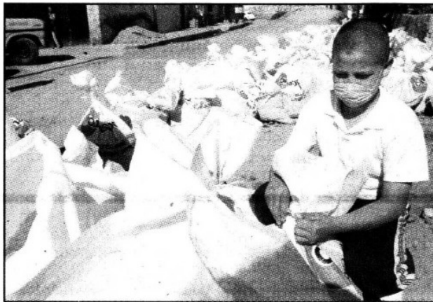
La única ayuda que recibieron fueron 3 mil bultos de arena