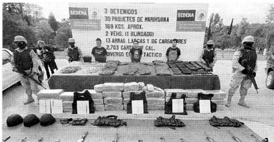
Decomiso en Tijuana.