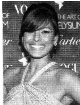
Eva Mendes.