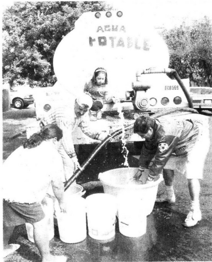
PREPAREN CUBETAS El Sistema de Aguas alista una flotilla de 430 pipas para distribuir el líquido en zonas donde el desabasto sea crítico