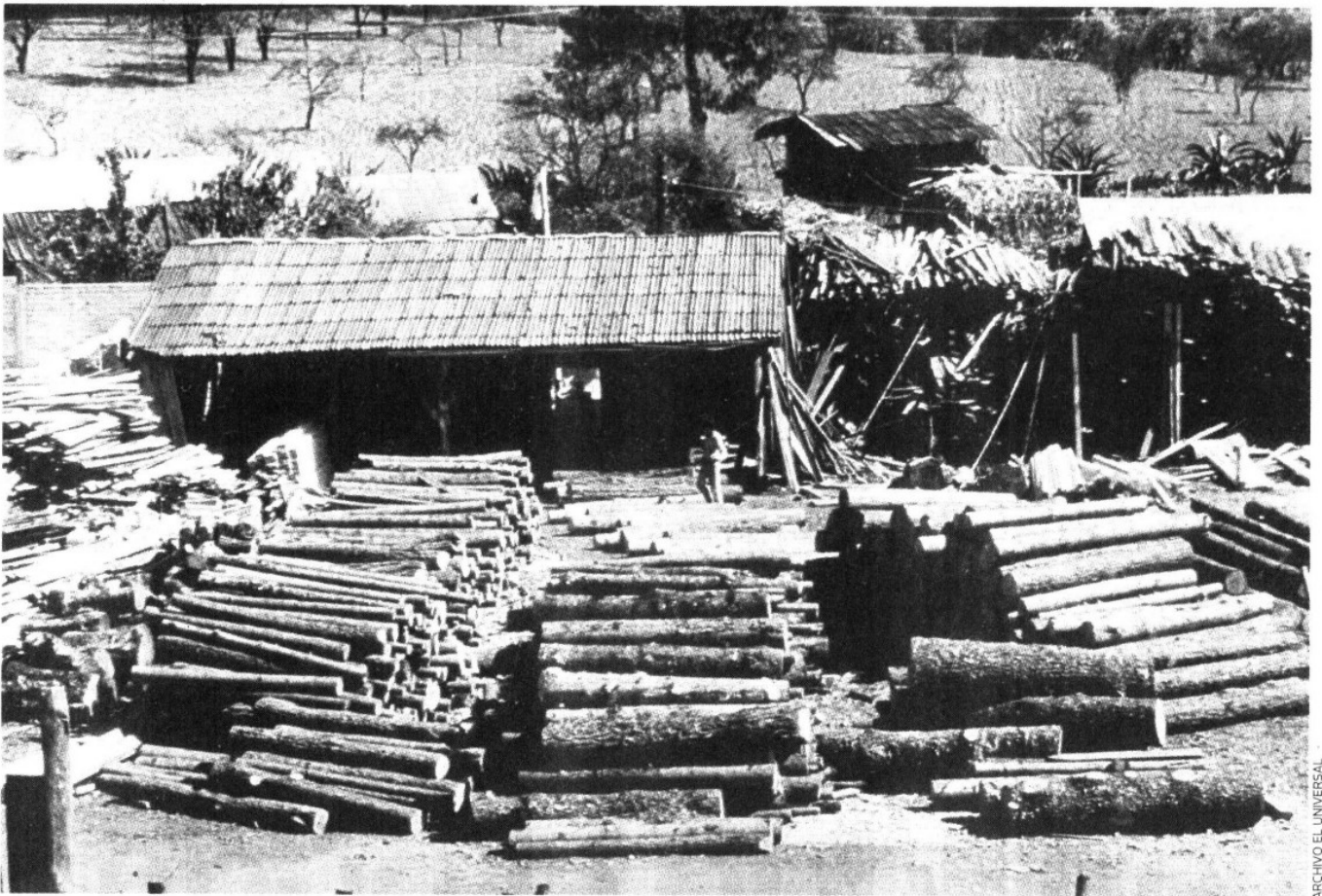
DAÑO México pierde al año 600 mil hectáreas de bosques por deforestación, de acuerdo con datos de organismos no gubernamentales

el mediano y largo plazos, microempresarios forestales, integrados a un mercado sustentable; sin embargo, admitió que solamente 58% de lo reforestado, sobrevivió