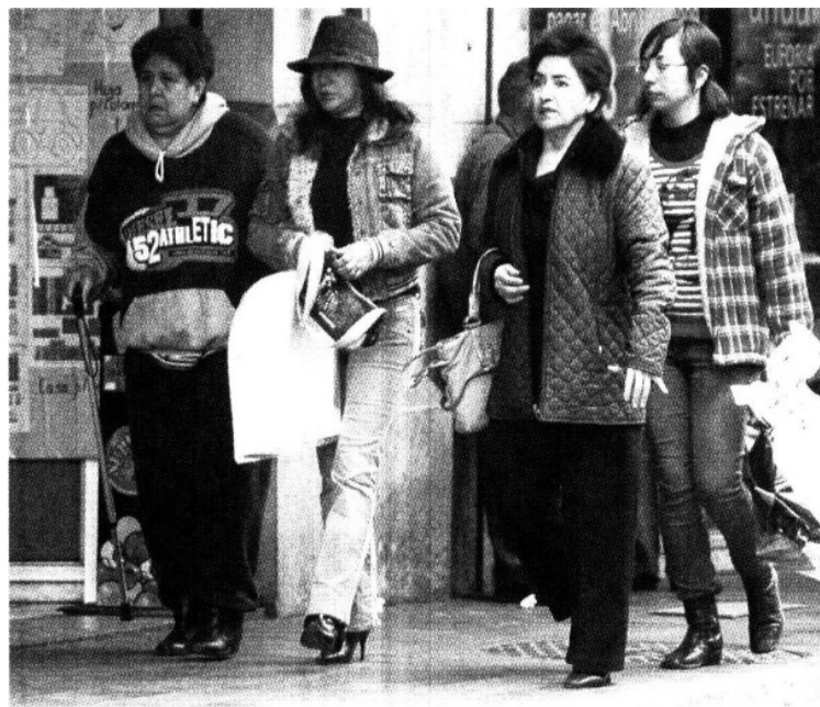
► Los efectos del frente frío número 24 provocaron en Veracruz bajas temperaturas y fuertes vientos.