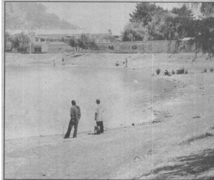
Causa desagrado entre la población y visitantes.