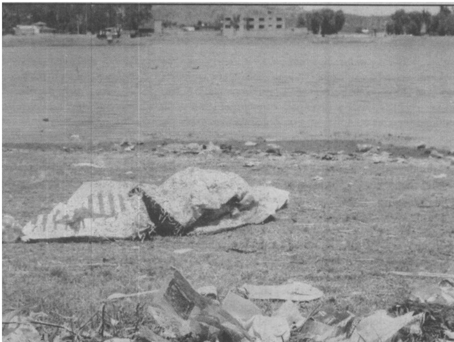
La laguna de Ojuelos luce descuidada, a pesar de ser reserva ecológica.