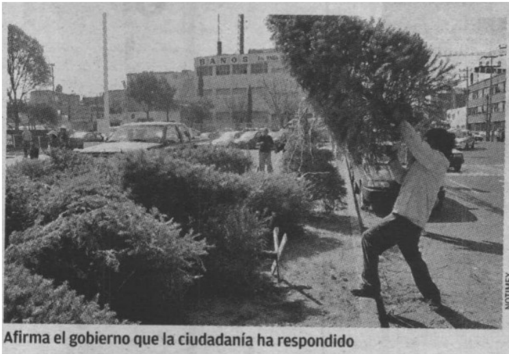
Afirma el gobierno que la ciudadanía ha respondido