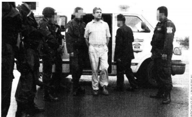
PRESO Fue capturado en España y extraditado a México