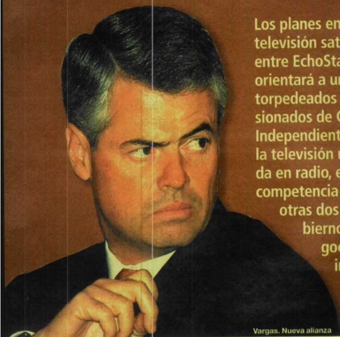
Vargas. Nueva alianza