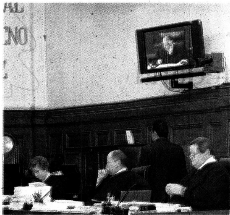
DISCUSIÓN: Ministros tendrán hoy la votación oficial.