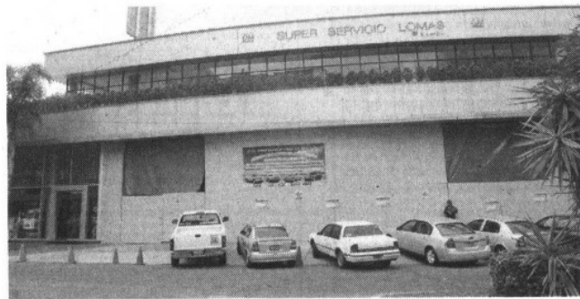
ANTES. En el lugar se encontraba el Super Servicio Lomas