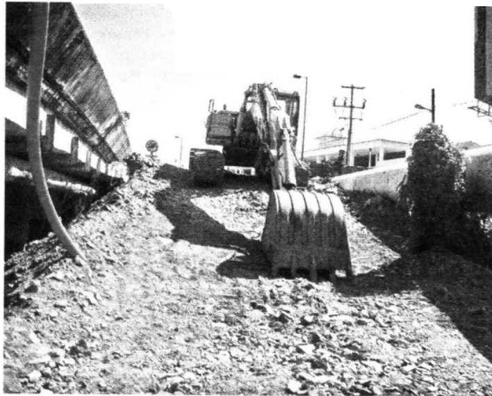
La Secretaría de Desarrollo Urbano y Obras Públicas del Gobierno de Guerrero admitió que la obra carece de autorización para ejecutarse.