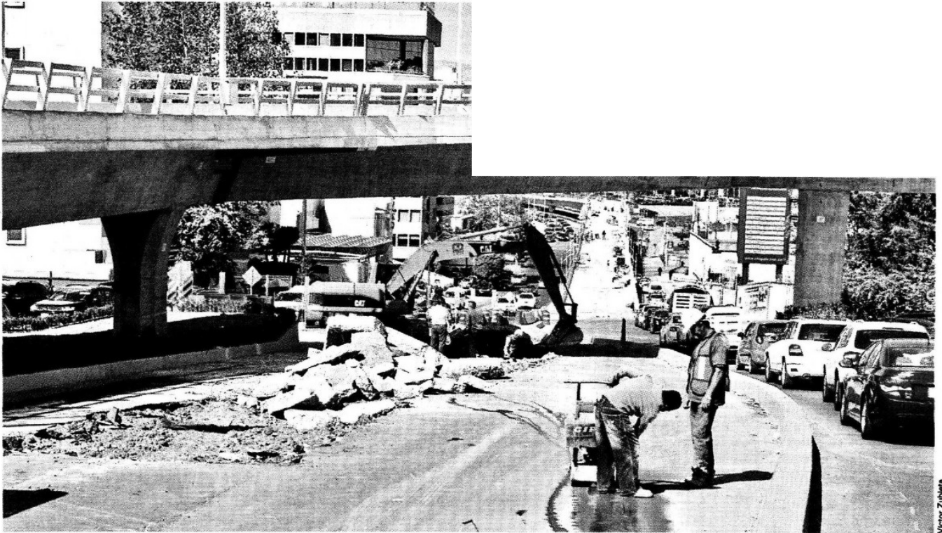
AHORCADOS. Los vecinos de Interlomas que se dirigen a Lomas Anáhuac y Tecamachalco sólo pueden usar el carril lateral, pues los dos que estaban debajo del nuevo puente de Paseos de la Herradura fueron cerrados para iniciar el estudio de suelos del desnivel a Barranca del Negro.