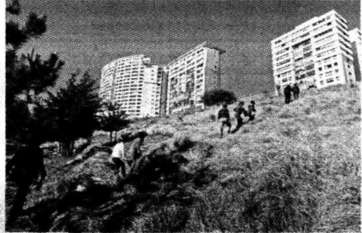
La excavación se lleva a cabo sobre antiguos tiraderos, lo que según los vecinos podría generar infecciones.