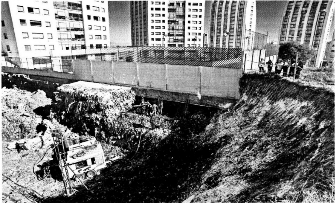
► Un particular construye sobre un tiradero que fue cerrado en 1999; la Semarnat establece que el saneamiento de estos espacios requiere 20 años.