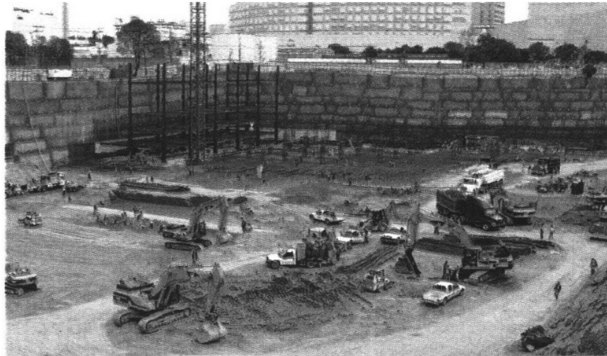
INICIO de construcción de Plaza Carso.