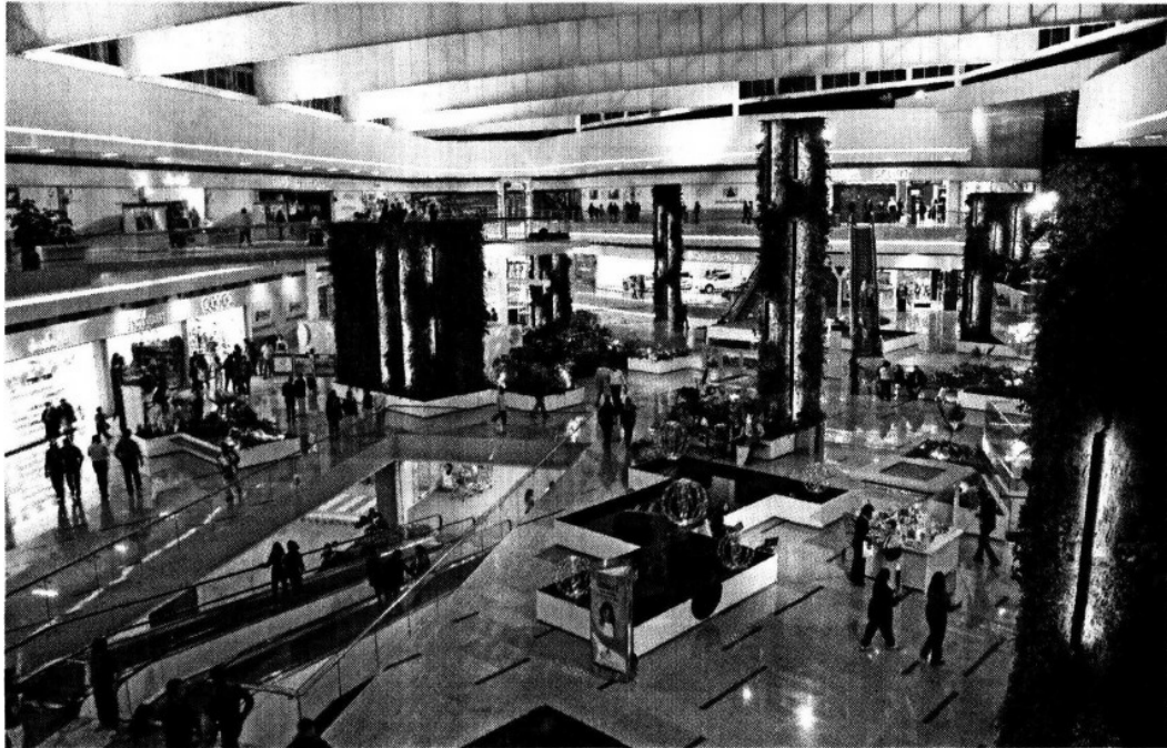
Muros verdes, luz natural y amplios espacios brindan una atmósfera única a los visitantes.