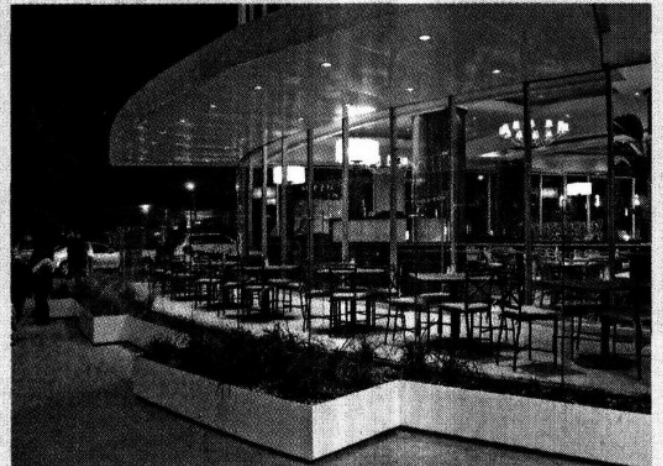
Excelente comida y servicio, sólo en Toks.