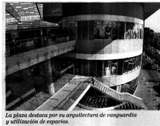
La plaza destaca por su arquitectura de vanguardia y utilización de espacios.