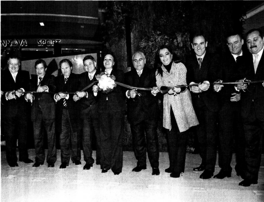
Autoridades y anfitriones durante el corte de listón de la Gran Terraza Lomas Verdes.