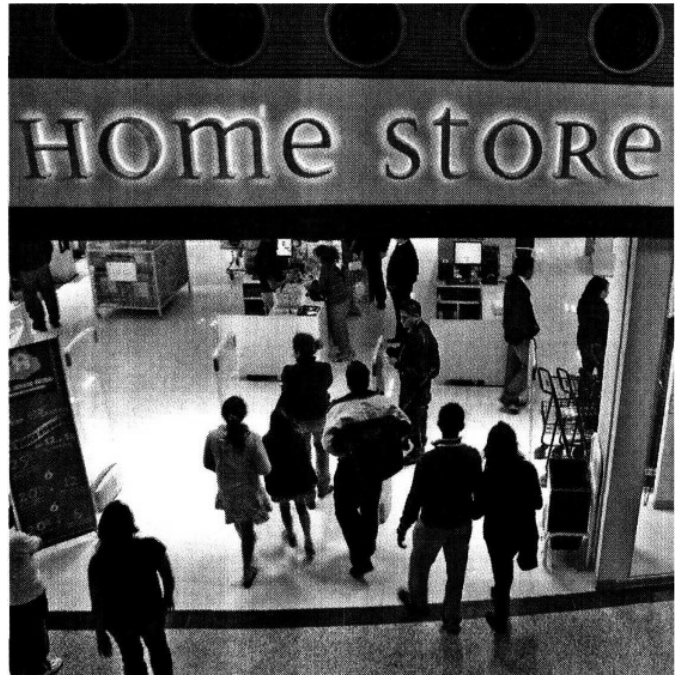
The Home Store ofrece todo para el hogar.