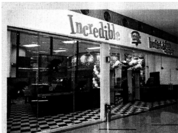
Incredible Pizza es uno de los muchos atractivos con que cuenta la plaza, debido a sus múltiples opciones de entretenimiento.