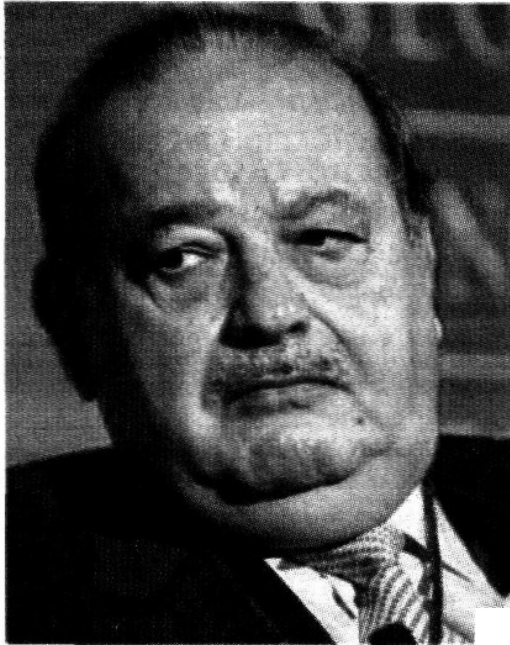
Carlos Slim. Expansión de América Móvil.