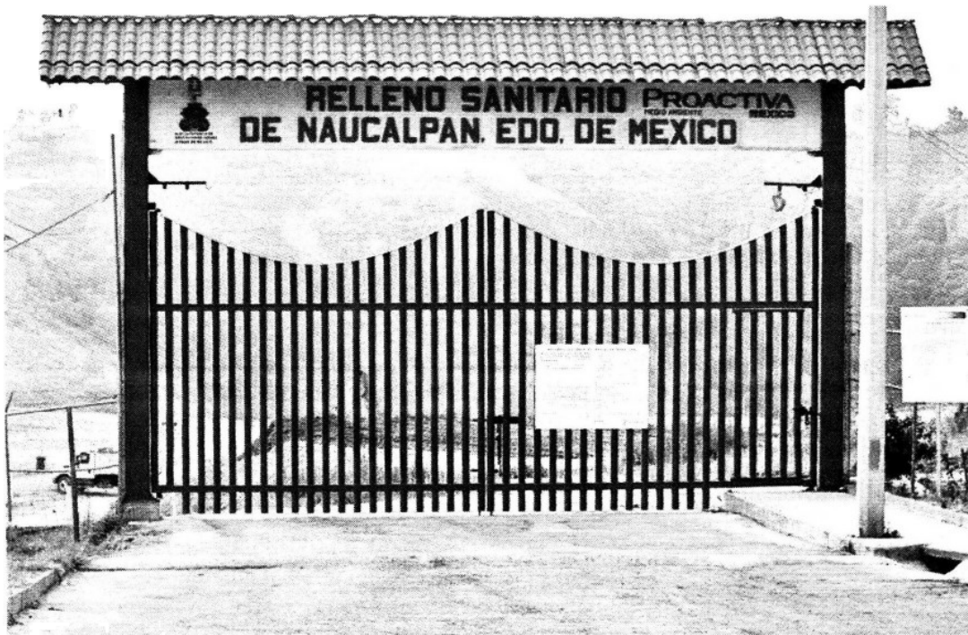
HASTÍO... La operadora del relleno dice haberse cansado de recibir los desechos sin pago por el trabajo.