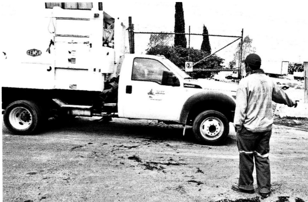
... Y APOYO. Las autoridades de Atizapán permitieron a Naucalpan llevar su basura temporalmente.