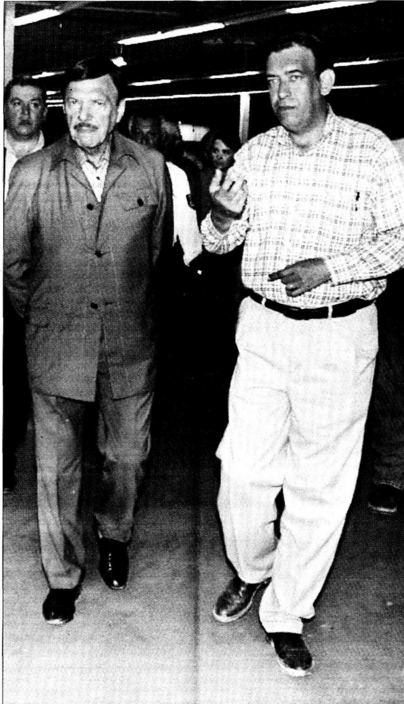
El presidente de Grupo Maseca y Grupo Banorte, Roberto González Barrera, y el gobernador de Coahuila, Humberto Moreira, durante un recorrido por uno de los centros de acopio de ayuda para los damnificados por el huracán Alex