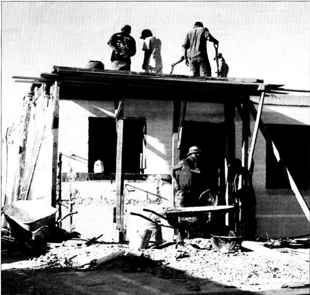
Los beneficiarios recibirán viviendas amuebladas y apoyo para la introducción del servicio de energía eléctrica