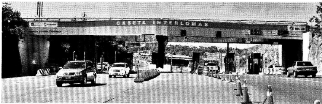
› Se prevé retirar una estructura de la caseta Interlomas para facilitar la llegada de las piezas prefabricadas.

El ramal de la Autopista también presentará afectaciones, pero a partir de la siguiente semana cuando será necesario cerrar el acceso a la carretera para poder introducir las traves durante las noches.