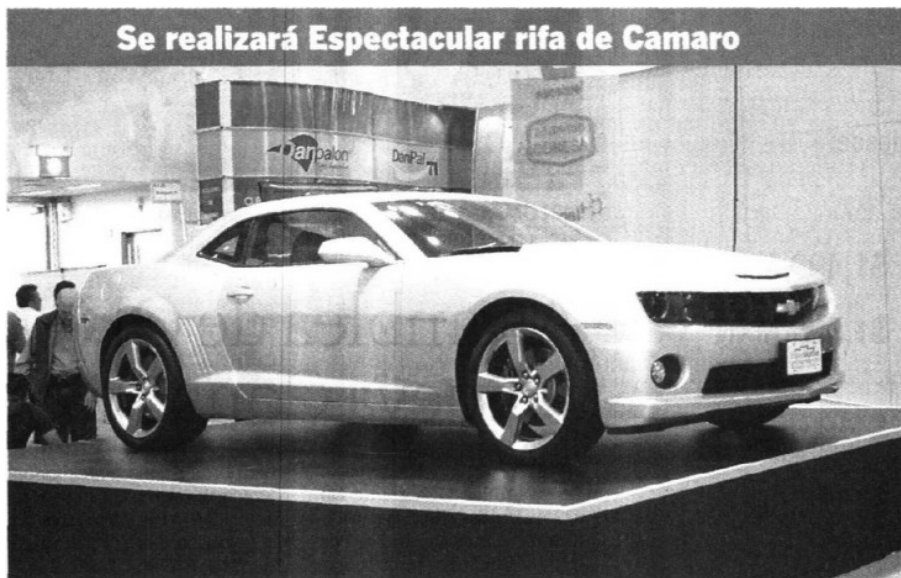
Continúa en siguiente hoja