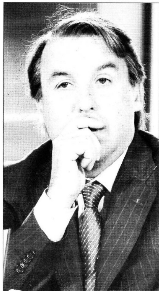
Ricardo Salinas Pliego, presidente de Grupo Salinas, y Emilio Azcárraga, presidente de Grupo Televisa