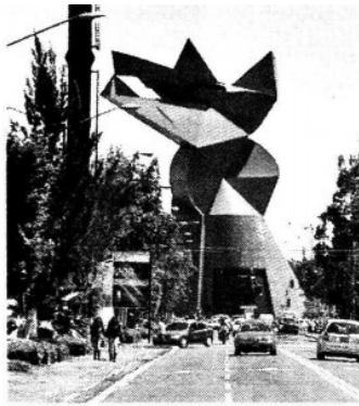
CABEZA DE COYOTE