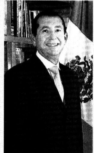
Zeferino Torreblanca Galindo, gobernador de Guerrero.