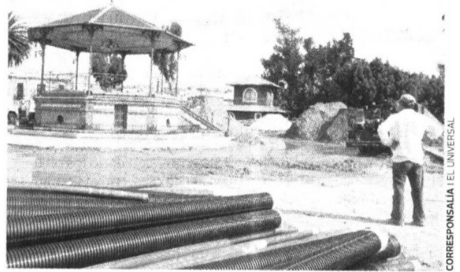
CORRESPONSALIA | EL UNIVERSAL

TABASCO. Se prevé que este lugar quede listo para mañana, así lo han asegurado las autoridades a pesar de que presenta un evidente retraso