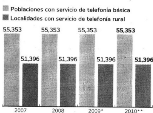
Servicio de telefonía básica y rural (localidades)