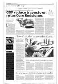
PLAZO. Trabajadores tienen 10 días para pavimentar laterales