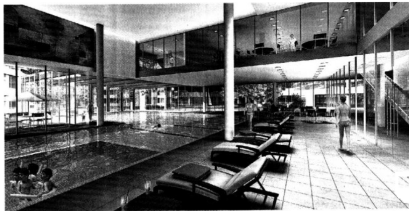
El Club House del área residencial brinda un sin fin de amenidades.