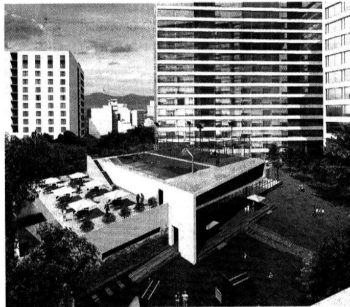
El proyecto integra residencias, torre de oficinas y centro comercial.