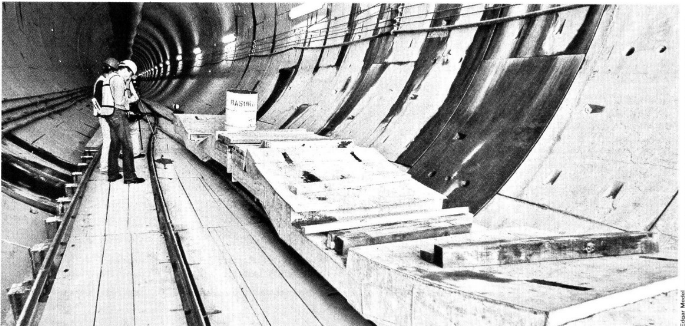
DESTAPE A LO GRANDE. La Tuneladora se encarga de abrirle camino a lo que será la Línea 12 del Sistema Metro, extrayendo material, que por lo regular es lodo, evitando que el suelo se derrumbe.

Se espera que en noviembre de 2011, La Rielera emerja del subsuelo luego de haber pasado por las estaciones Mexicaltzingo, Ermita, Eje Central, Zapata e Insurgentes Sur.