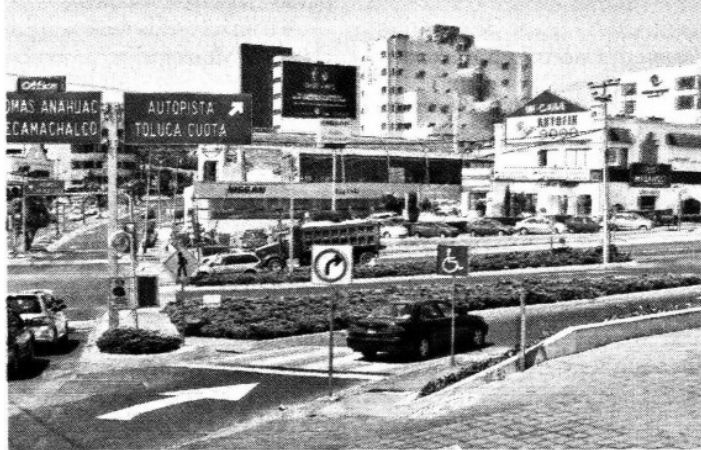
> Uno de los puentes elevados será edificado en la glorieta de Magnocentro, en las inmediaciones de Interlomas.