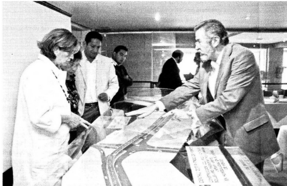
> Vecinos de Huixquilucan conocieron una maqueta donde están los detalles de las obras proyectadas por el Centro México de la Secretaría de Comunicaciones y Transportes.