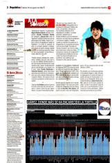
Gráfico: Alejandro Gómez