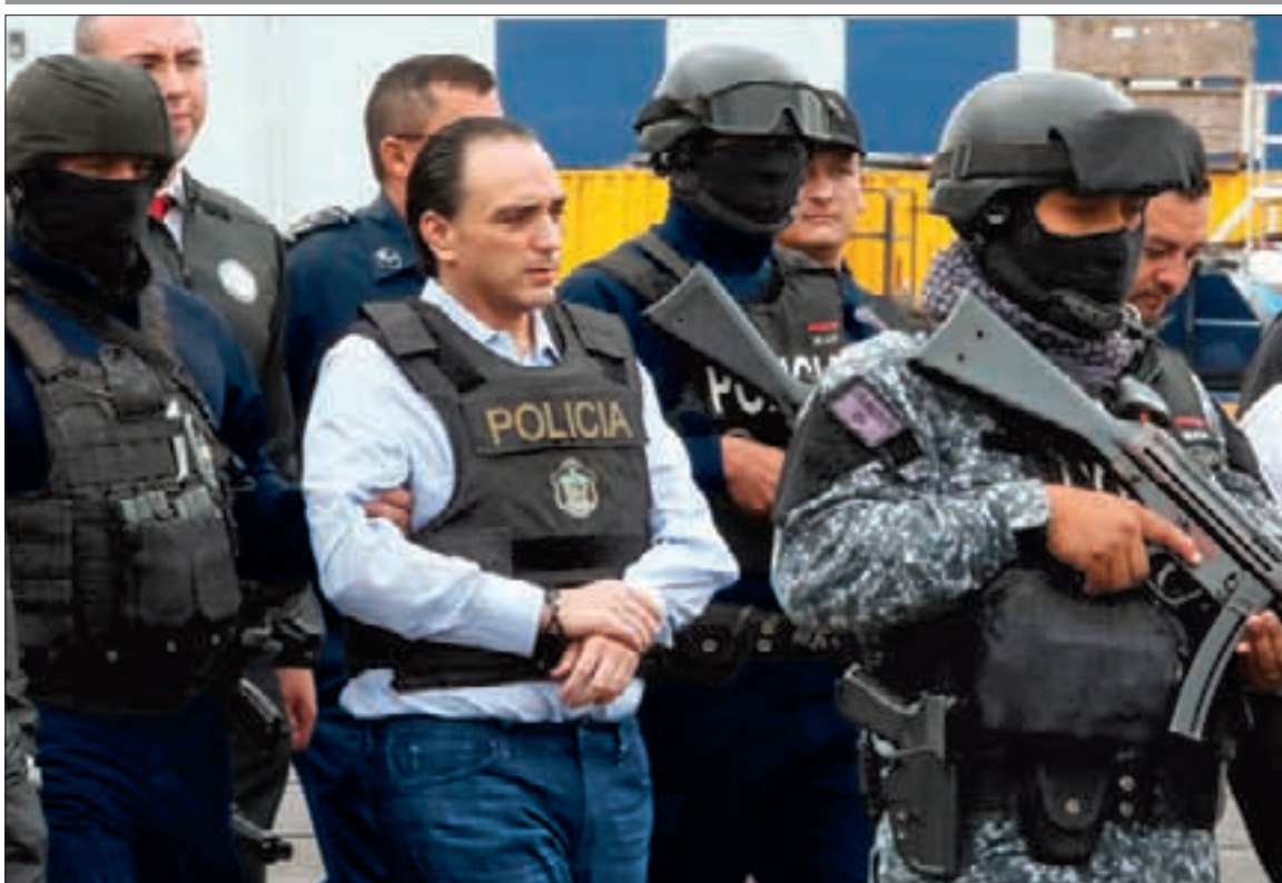
El exgobernador de Quintana Roo es llevado al avión que lo trasladó de Panamá a la Ciudad de México.