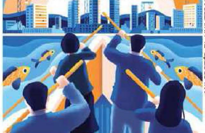
ANI CORTÉS. EL UNIVERSAL